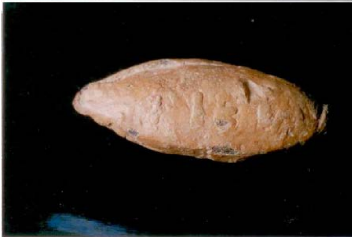
Fotografías de Alejandro Plaza, en Gómez Pantoja - Morales Hernández 2002: 305