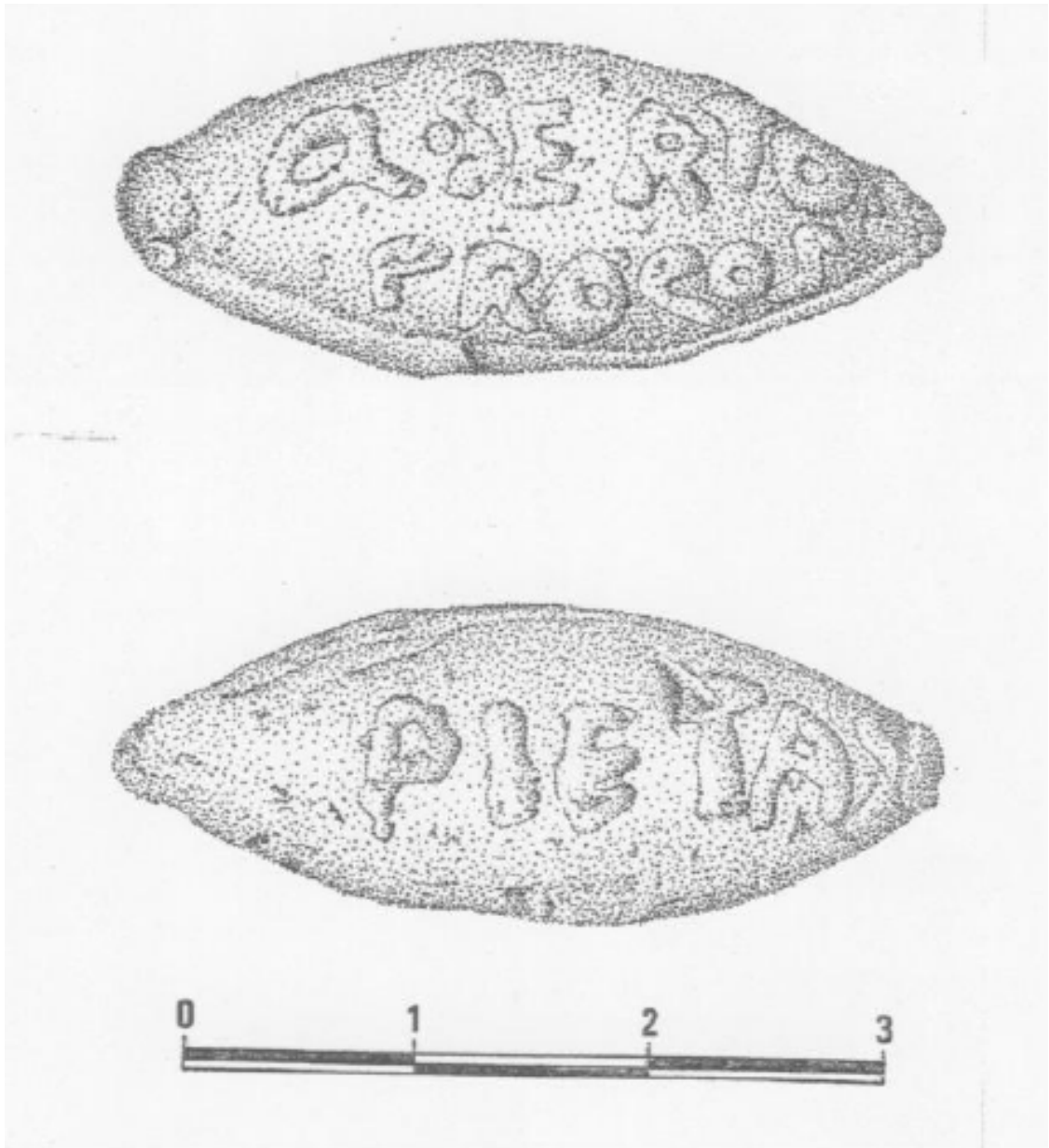
Dibujo de Fernando Morales en Gómez Pantoja - Morales Hernández 2002: 310