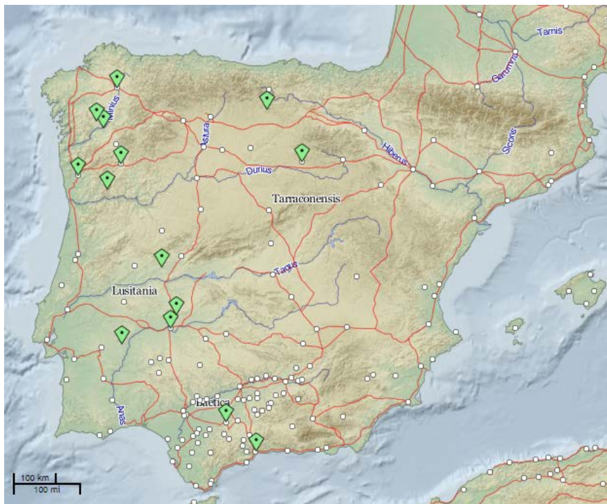
Fig. 1: Dispersión de la fórmula ex visu - visu en Hispania. Elaboración propia